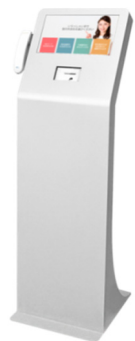
フロアタイプ (ユニットなし)

moreReception のフロアタイプ、カウンタータイプの背面にカードディスペンサーユニットを装着。受付用 QR コードをかざすと入館カードを発行、セキュリティゲートとの連携も可能です。入館カード発行時に、カード情報とあわせて、いつ誰にどのカードを発行したかを moreReception に記録するため、入館カードの紛失リスクを軽減できます。また、セキュリティゲートとの連携により、入館カード発行時に入館権限を付与することも可能です。盗難や不正入館などへのセキュリティ対策を実現できます。