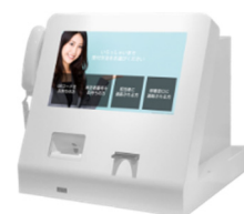
カウンタータイプ (ユニットあり)