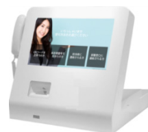
カウンタータイプ (ユニットなし)