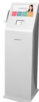
フロアタイプ (ユニットあり)