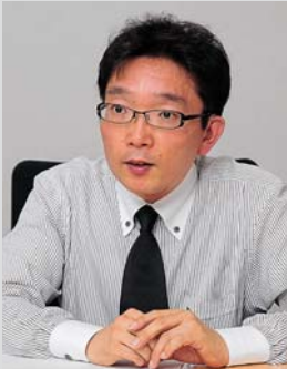
アステラス製薬株式会社 コーポレートIT部 インフラグループ 課長代理

サーバーの老朽化などを受け、コーポレートサイト運用基盤の再構築に着手した製薬会社大手のアステラス製薬。大規模災害などの発生時にも、確実にサービスを継続するためにインフラに採用したのが「アマゾン ウェブ サービス」です。国内と海外のデータセンターを併用することで、万全の災害対策を実現。また、トレンドマイクロの「Trend Micro Deep Security™」を採用し、クラウド環境の安全性強化にも成功しています。