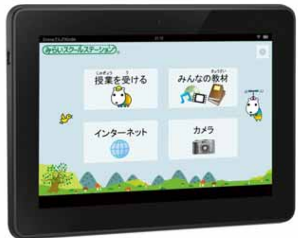
【Kindle Fire HDX 上の「みらいスクールステーション」トップ画面イメージ】

「第5回教育ITソリューションEXPO」出展について http://www.fsi.co.jp/event/EDIX/index.html