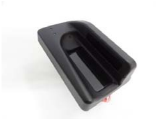
指静脈認証モジュール (組込用モジュール) 「FVA-M1ST」