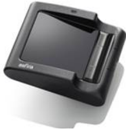
USB 接続指静脈接続ユニット (スタンドアロンユニット) 「FVA-U2SXA」