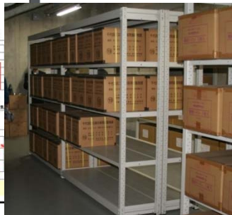
<秋葉原ビル 地下の千代田区備蓄品>