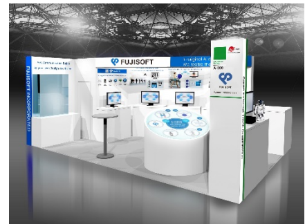
「CeBIT2017」富士ソフトブースイメージ