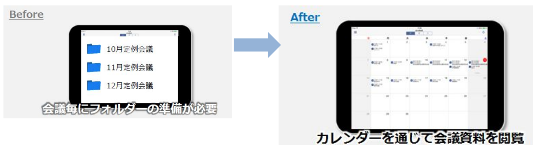
【 カレンダー画面イメージ 】

カレンダーを通じて会議毎に参加者の設定と資料を配布。参加者はカレンダーに登録されたイベントをクリックするだけで moreNOTE の会議資料を閲覧できるため資料までのアプローチがより簡単になります。