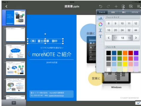
【編集画面イメージ】

■Office 文書編集 (Word、Excel、PowerPoint) ※iOS 版、Android 版に対応 moreNOTE アプリケーションを介した Office 文書の作成・編集が可能になります。編集した文書はそのまま moreNOTE に保存。タブレット本体には保存されないため、セキュリティも万全、外出先や打合せ中の利用にも便利な機能です。