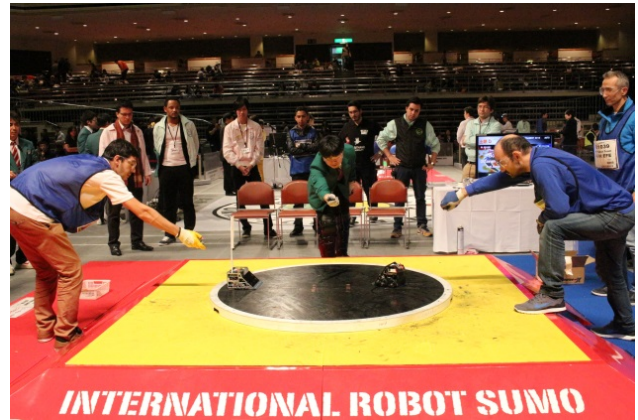
〈昨年度「INTERNATIONAL ROBOT SUMO TOURNAMENT 2015」の様相〉