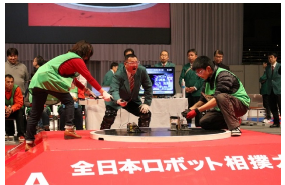
<昨年度「全日本ロボット相撲全国大会」の様相>

第3回大会の今回は、海外で開催されたロボット相撲大会のうち公認16大会の上位入賞者が出場し、ブラジル、コロンビア、エクアドル、スペイン、エストニア、ラトビア、リトアニア、メキシコ、モンゴル、ペルー、ポーランド、ルーマニア、トルコ、中国、パラグアイ、アルゼンチン、コンゴ、インドネシア、エジプト、アメリカ合衆国、カナダ、オーストリアのチームが世界一の座を巡って熱い戦いを繰り広げます。