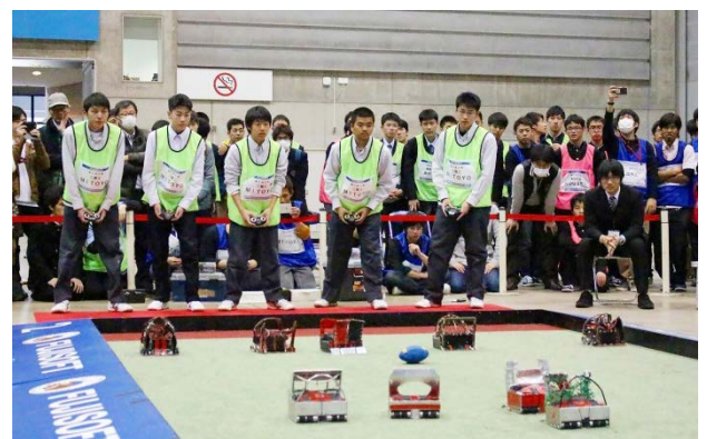
前回大会の様様 優勝:香川県立三豊工業高等学校 (現 観音寺総合高等学校)