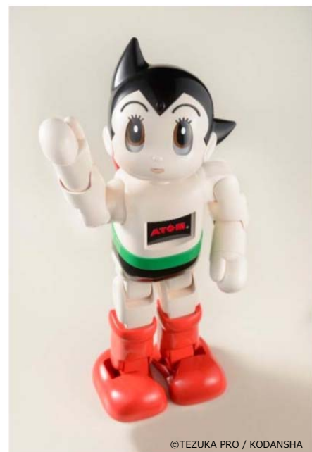
コミュニケーションロボット ATOM