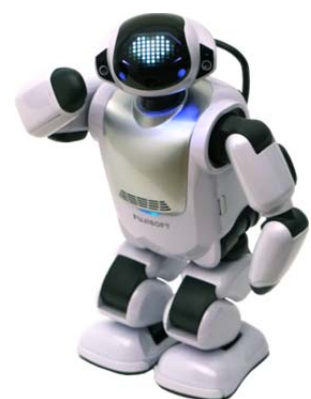
コミュニケーション ロボット PALRO