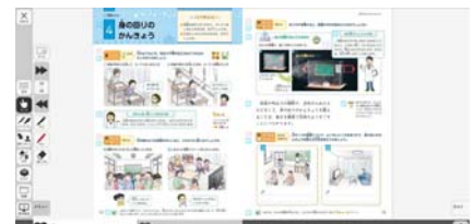
株式会社学研教育みらい様 デジタル教科書サンプル

「株式会社学研教育みらいでは、本格的なデジタル教科書導入の時代にあたり、期待されているアクセシビリティの向上や、導入・活用のしやすさ等を踏まえ、シンプルで使いやすく、さまざまなデバイスにも対応できる富士ソフト株式会社の『みらいスクールプラットフォーム』を採用することといたしました。『みらいスクールプラットフォーム』を活用し、よりよい学びをサポートして参ります。」