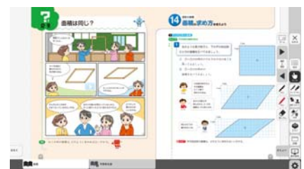
学校図書株式会社様 デジタル教科書サンプル

「学校図書株式会社は、『多様性を前提とした問題解決能力の育成』を教科書編集理念として、2020年度版小学校新教科書を発行いたしました。また、同理念の基、富士ソフト株式会社の『みらいスクールプラットフォーム』を基本基盤として、2020年度版小学校デジタル教科書を発行いたします。今後も学校図書株式会社は、富士ソフト株式会社と連携し、使いやすく質の高い教育コンテンツを提供して参ります。」