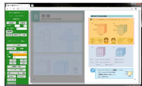
デジタル教科書・デジタル教材作成ツール画面イメージ

教科書・教材の紙面データ(原稿レイアウト・デザイン)と素材データ(教科書紙面のテキスト、画像、動画、音声、既存教材等)、表示ライブラリを組合せて、デジタル教科書・デジタル教材を作成するツール。作成にかかる時間、制作者の負担を大幅に軽減。