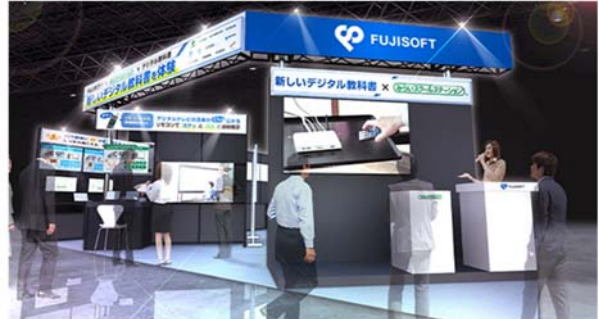
富士ソフトブースイメージ