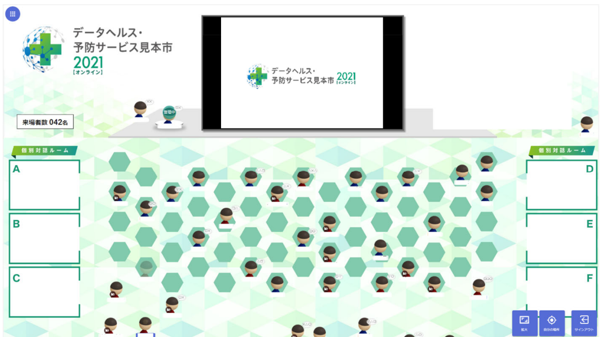
FAMEvent を使ったバーチャル展示ブース

令和3年度「厚生労働省予防・健康インセンティブ推進事業」として、医療保険者、企業健康増進担当者、自治体、事業主を対象とした「データヘルス・予防サービス見本市 2021」のバーチャル出展ブース、オンライン交流会に、FAMEventが採用されました。円滑なコミュニケーションにより、リアル開催と遜色ない満足感を実現しました。